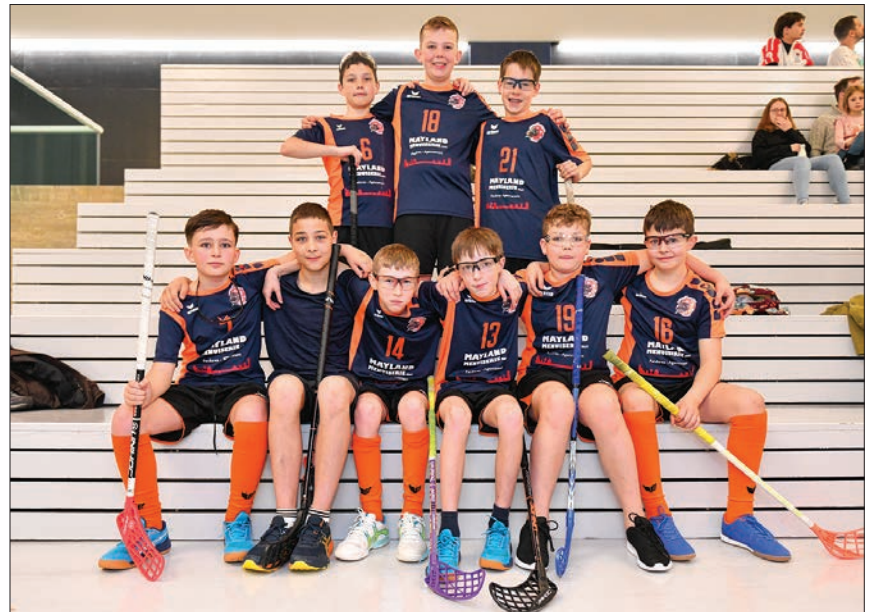
Les «Tchoutchou», une équipe principalement composée des juniors du Lokomotiv unihockey club de Sainte-Croix.