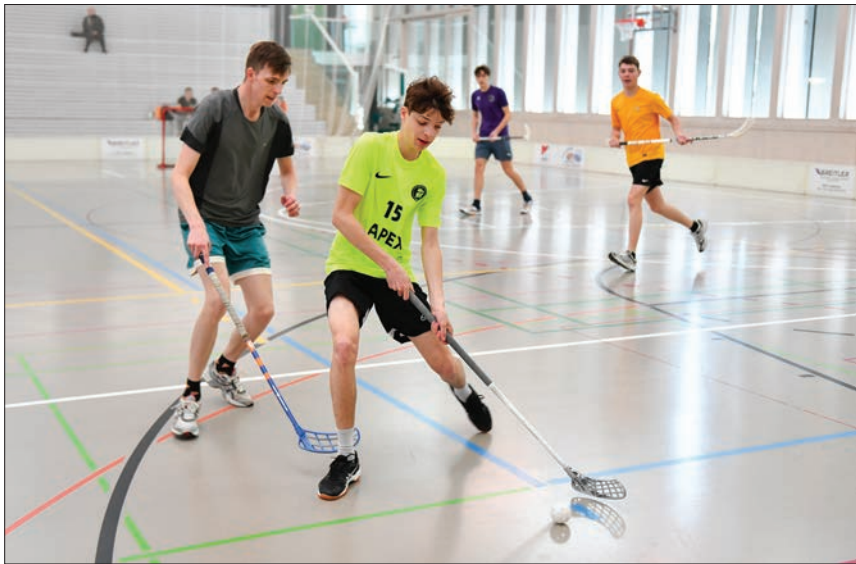
Duel entre le Val-de-Travers et le Balcon du Jura.