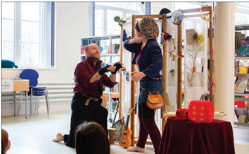
Ce sont deux amis qui se sont unis afin de créer la compagn'ihiliste où Yvette, personnage fictif, les guide à travers les épreuves.

Pour les enfants comme pour les parents, une nouvelle aventure interactive et improvisée vous sera proposée par la compagnie « Compagn'ihiliste » et la bibliothèque de Sainte-Croix en septembre. N'hésitez pas à consulter le site Internet de la compagnie pour connaître leurs prochaines dates : www.compagn-i-hiliste.ch