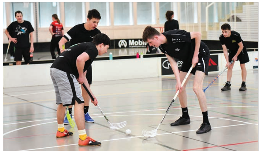
Un duel de Jeunesses entre Bousens et Molondin.

détente et d'échanges entre passionnés. Au-delà de la simple pratique sportive, ce tournoi de Unihockey