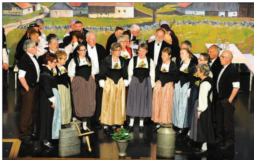
Le groupe «Grubenchörli» venu de la région du Saanenland.