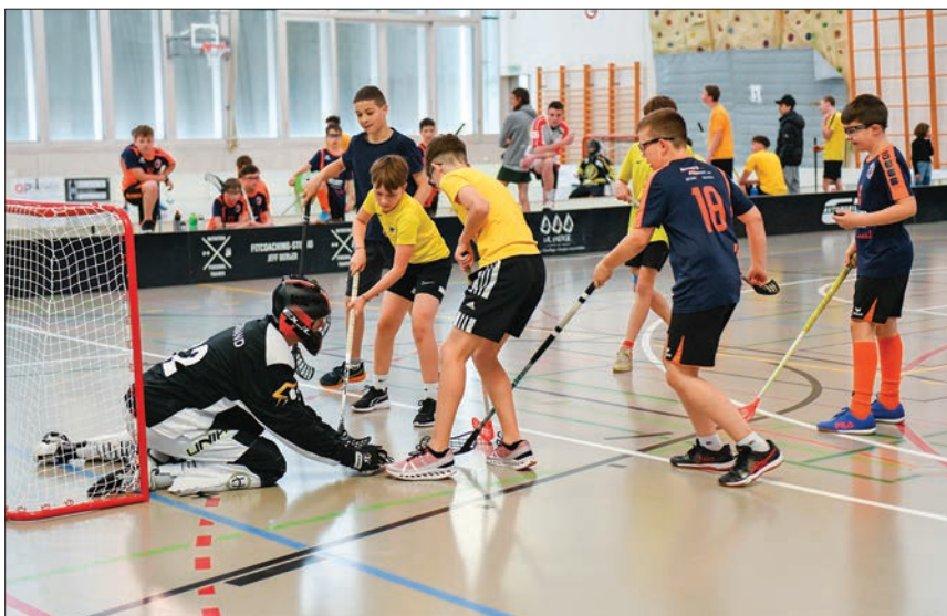
Chaude alerte devant le but.

L'effervescence du tournoi a atteint son apogée lors des phases finales, où chaque équipe s'est surpassée dans un esprit de compétition féroce mais fair-play. Entre deux matchs palpitants, les participants ont trouvé réconfort et rafraîchissement grâce à une restauration de qualité à midi et une buvette bien achalandée sur place, propices à des moments de