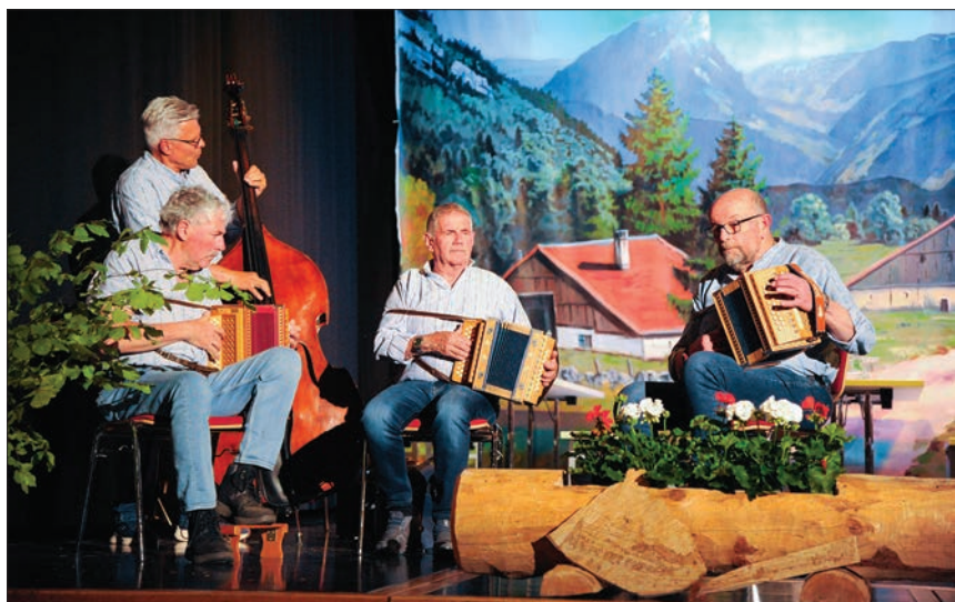
L'Écho du Pilichody a animé les intermèdes et la partie familiale.