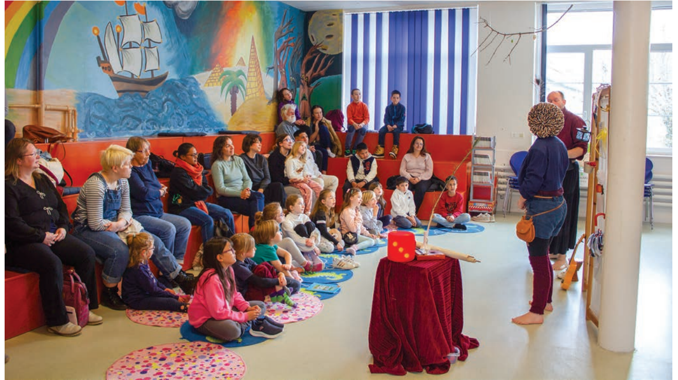
Une vingtaine de personnes étaient présentes pour découvrir cette expérience.

Grâce aux décisions des spectateurs, nos valeureux protagonistes ont été accompagnés par un compagnon inattendu, un chien, (une option non prévue par les artistes) afin d'affronter le ver de terre géant qui se cachait chez sa grand-mère, munie d'une épée enchantée. Leur mission : ramener les