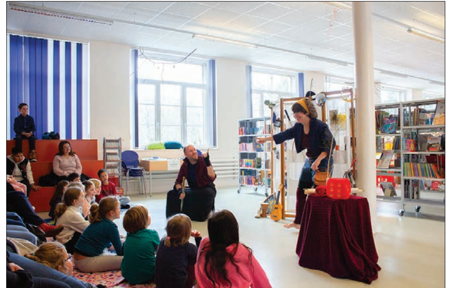
Ils seront présents à l'inauguration du musée MuMAPS, le 1 er et 2 juin.