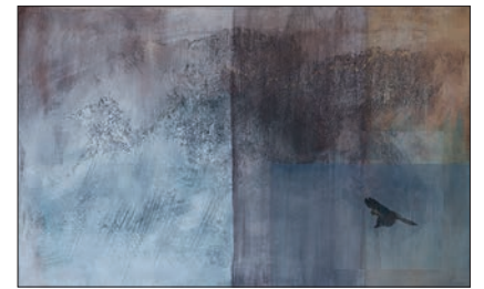
Mica : « Méditation ».