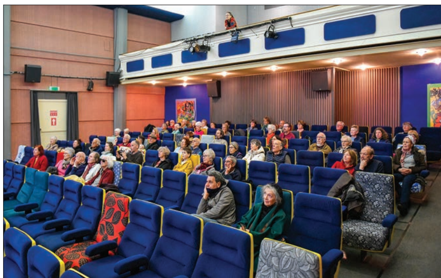
Le public a pu échanger avec la réalisatrice.

Un spectacle réjouissant, tant pour l'esprit que pour le cœur ! Entrée libre, panier à la sortie. J.-Ch. Jaermann