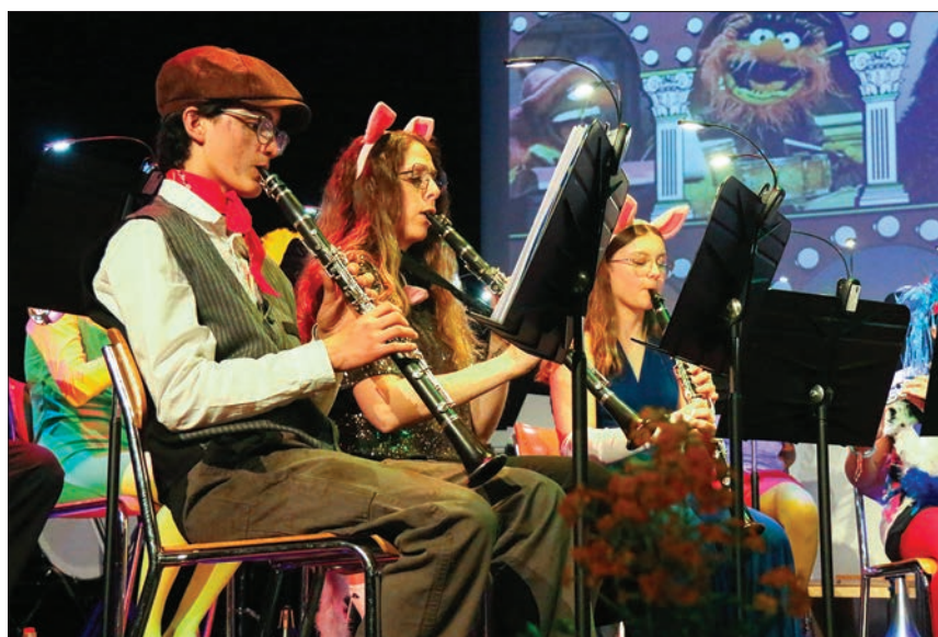
Le registre des clarinettes.