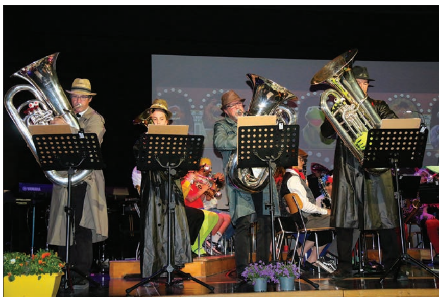
Ils interprètent Tubagatelle.