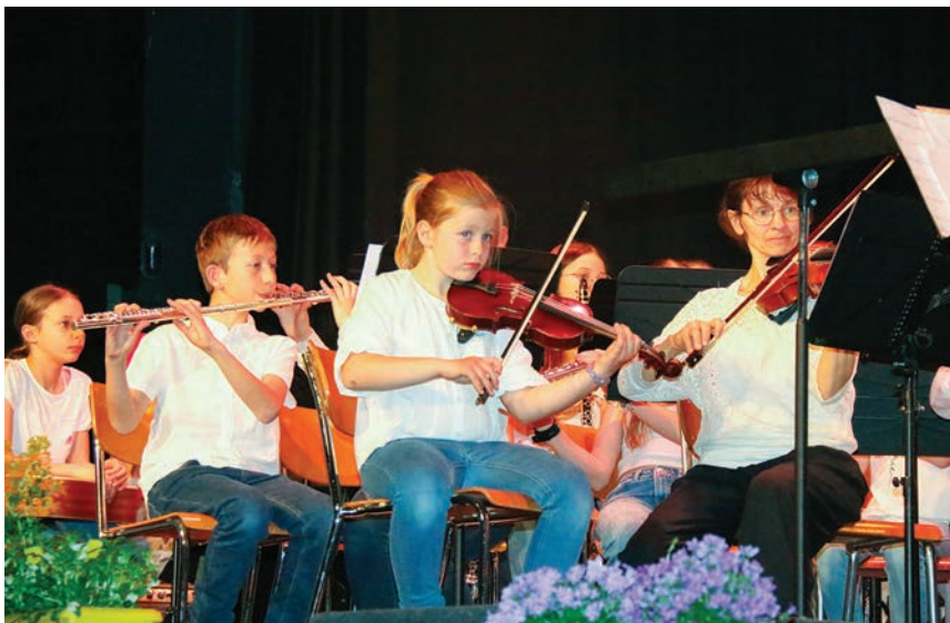
Des jeunes motivés et appliqués.

Un concert varié à souhait, des musiciens enthousiastes emmenés par des directeurs plus que compétents, que faudrait-il de plus pour vivre une excellente soirée?