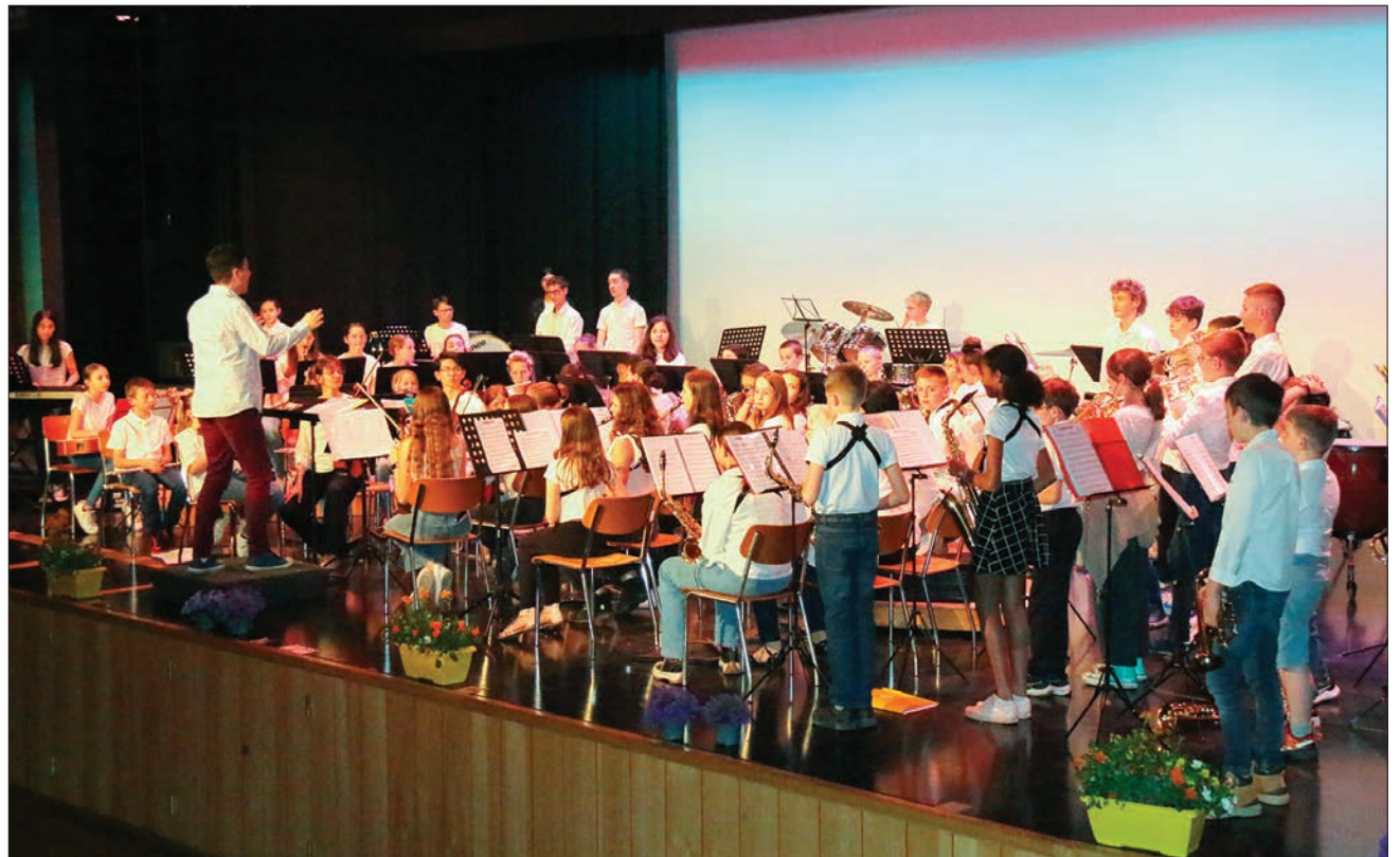
Quatre écoles de musique réunies.

À travers ce projet fédérateur, les musiciens ont pu percevoir les particu-