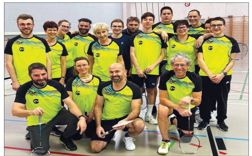
Une partie des membres dans leurs nouveaux maillots.

Le Badminton Club de Sainte-Croix a fêté ses 20 ans l'année passée, en organisant une soirée Fluo ouverte à tous, ainsi qu'une sortie du club aux Tennis Swiss Indoors de Bâle. À l'occasion de ce jubilaire, les joueurs des Inter Club ont eu l'heureuse surprise de se faire sponsoriser par l'entreprise DEM3 et ont reçu de nouveaux maillots, jaunes fluos pour l'occasion. Qu'elle en soit remerciée publiquement, joli geste sportif et amical. Le Club dont les effectifs restaient stables mais peu étoffés peut compter dorénavant